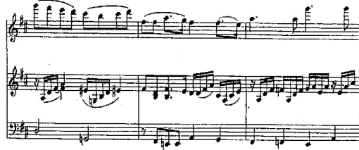
شكل رقم (14) م 27 : م 29

○ أن يتدرب دارس البيانو على التقنيات العزفية بإتباع الإرشادات العزفية للموازير من م 27 : م 29