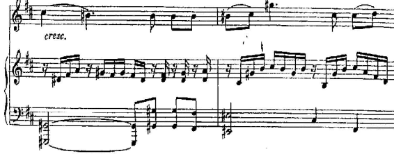
شكل رقم (8) م 15 : م 16