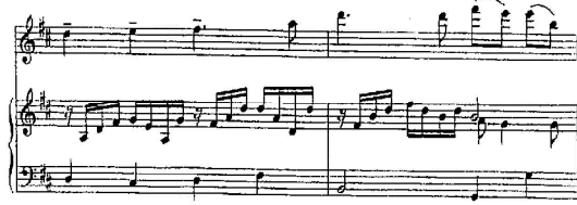
شكل رقم (11) م21 : م22

➤ التقنيات العزفية بإتباع الإرشادات العزفية للموازير من م21 : م22