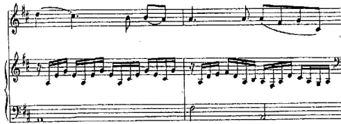
شكل رقم (3) م5 : م6