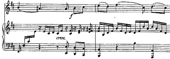
شكل رقم (7) م 13 : م 14