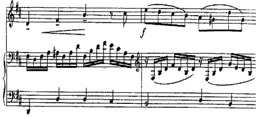
شكل رقم (4) م7 : م8

○ أن يتدرب دارس البيانو على التقنيات العزفية بإتباع الإرشادات العزفية للموازير م7 : م8