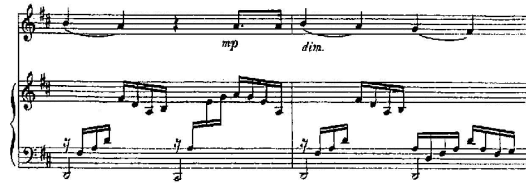
شكل رقم (16) م33 : م34