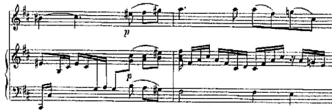
شكل رقم (10) م19 : م20