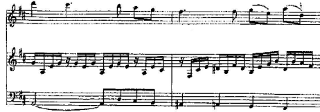
شكل رقم (12) م23 : م24

➤ التقنيات العزفية بإتباع الإرشادات العزفية للموازير من م23 : م24