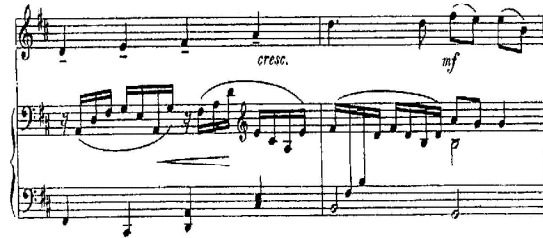
شكل رقم (2) م3 : م4