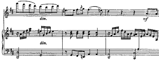
شكل رقم (15) م30 : م32