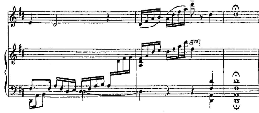
شكل رقم (17) م35 : م37

○ أن يتدرب دارس البيانو على التقنيات العزفية بإتباع الإرشادات العزفية للموازير من م35 : م37