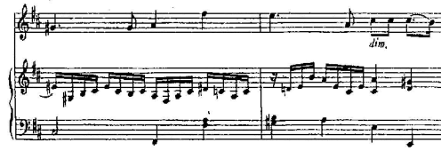
شكل رقم (5) م 9 : 10م