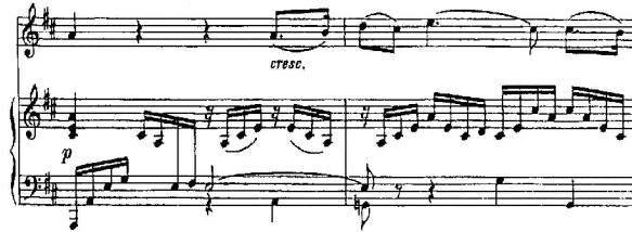
شكل رقم (6) م 11 : 12م