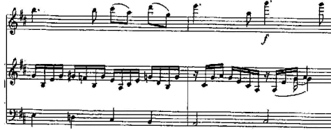
شكل رقم (13) م25 : م26