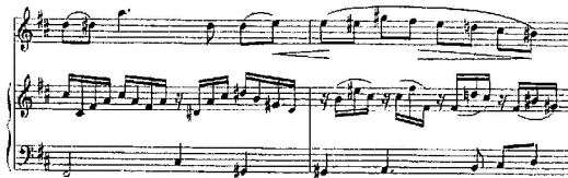
شكل رقم (9) م 17 : م 18